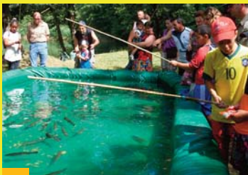
Journée de la pêche