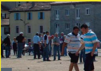
Grand prix à pétanque