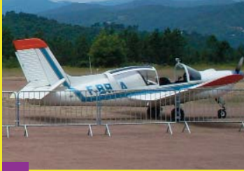
Fête de l'air