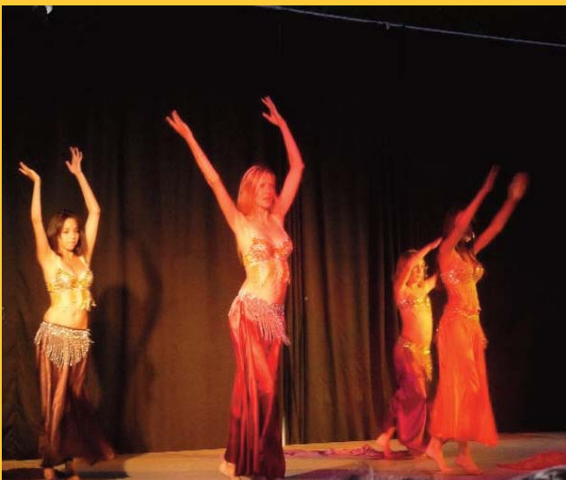
Danses orientales, Hip-Hop, Variétés ont égayé en fin de semaine, les soirées sur la place Jean Jaurès.