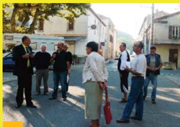
Visites de proximité