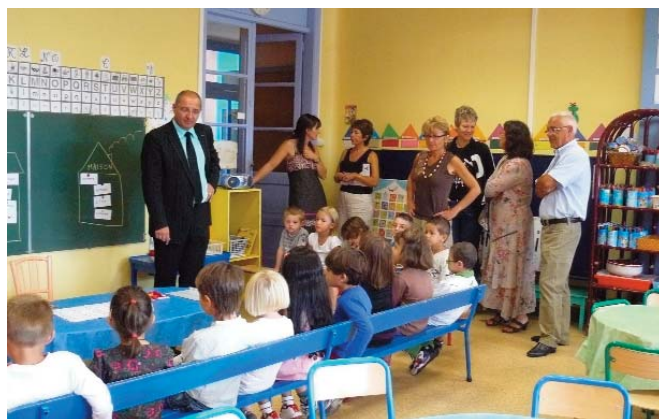
Les petits de l'école maternelle Jules FERRY déjà très attentifs !

Avec 1216 élèves, et la scolarisation des enfants de 2 ans, les effectifs sont en progression, de la maternelle au lycée. Durant l'été, les travaux ont été effectués par le personnel communal dans les différentes écoles publiques de la ville. L'entretien des bâtiments et l'acquisition de matériel et/ou de mo-