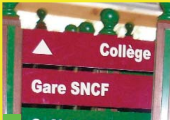
Une nouvelle signalétique