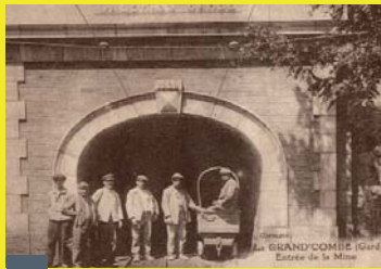
Les 100 ans de la Galerie Sainte Barbe