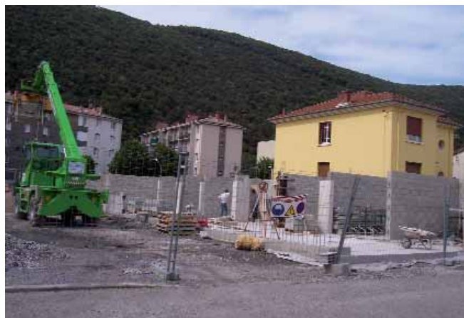
Un grand et beau projet sort de terre aux Pelouses

Coût de l'opération : 11 millions d'euros.