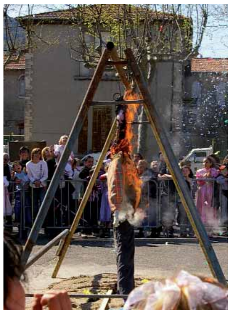
Carnaval des enfants