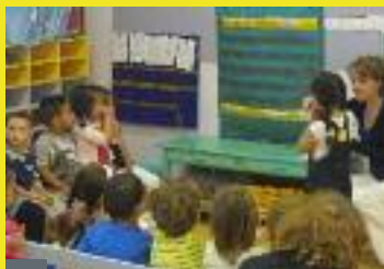
Rentrée des classes