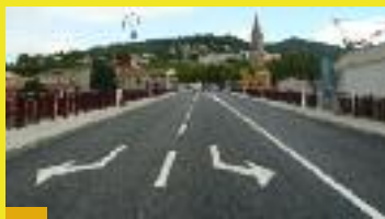
Pont Germain Soutelle