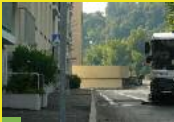
Quartier Les Pervenches