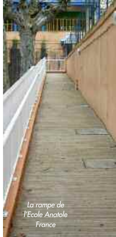
La rampe de l'école Anatole France

La Grand'Combe et le Pays Grand'Combien font figure de bons élèves dans la mise en accessibilité des établissements recevant du public (loi sur le handicap de 2005). Sur la commune, les aménagements se poursuivent à intervalles réguliers. Après la réalisation de la rampe d'accès à l'école Anatole France, la maison du Mineur peut accueillir les personnes à mobilité réduite grâce au même dispositif que vient compléter l'ascenseur. La maison des Jeunes, la piscine, la salle polyvalente Denis Aigon, l'hôtel de communauté, la salle Marcel Pagnol, l'OIT, les tribunes du stade André Drulhon répondent également aux normes d'accessibilité.