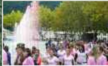
Par l'engagement des jeunes