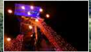
En découvrant la performance du Groupe F