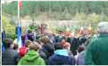
Par l'hommage à la corporation minière